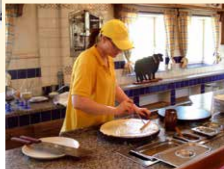
Palatschinkenstation in der Bahnhofsbäckerei

Das übersichtliche Selbstbedienungsrestaurant mit nostalgischem Flair lässt die Herzen aller „Mehlspeistiger“ höher schlagen. Hier werden unsere Gäste mit frisch zubereiteten Palatschinken in vielen Variationen, herzhaften Waffeln, verführerischen Eiskreationen und feinen Mehlspeisen verwöhnt. Im kleinen aber feinen Shop werden Spezialitäten und Weine aus der Region, sowie die unverkennbare „Burgenländische Hochzeitsbäckerei“ angeboten.