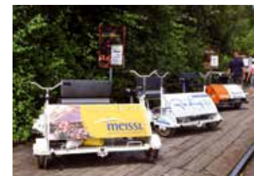
So wird geparkt

Um auch wirklich gemütlich rasten zu können, kann man die Draisine problemlos auf den vorgesehenen Parkplätzen in den Orten herausheben und abstellen.