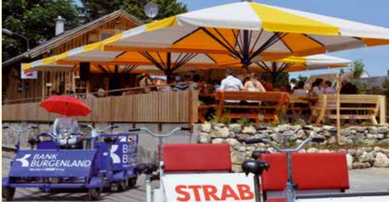
Magazin in StooB

Scannen für mehr Infos zur Gastronomie auf den Stationen.