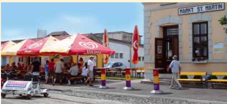
Mittelstation in Markt St. Martin

Gemütliche Eisenbahner-Atmosphäre herrscht am Bahnhof Markt St. Martin. Der kulinarische Schwerpunkt liegt hier auf traditionell burgenländischen Gerichten wie hausgemachtem Bohnensterz mit Rahmsuppe, das sogenannte „Burgenländische Menü“. Für Gruppen wird auf Vorbestellung auch das Rustikale Buffet und das klassische Schnitzelbuffet angeboten oder man lässt es sich à la carté schmecken. In der frischen Luft, unter den schattigen Sonnenschirmen, schmeckt es bekanntlich gleich nochmal so gut!